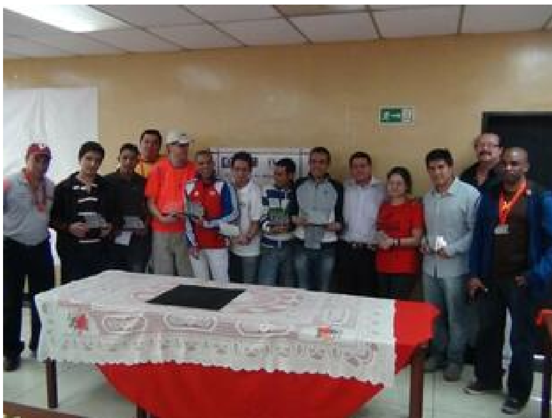
Representante del Metro de Caracas durante la premiación.