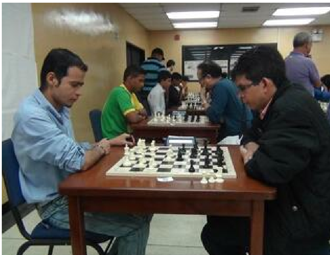
Los Ganadores del IRT Blitz de Noche Metro de Caracas “Profesor Andrés Bello”